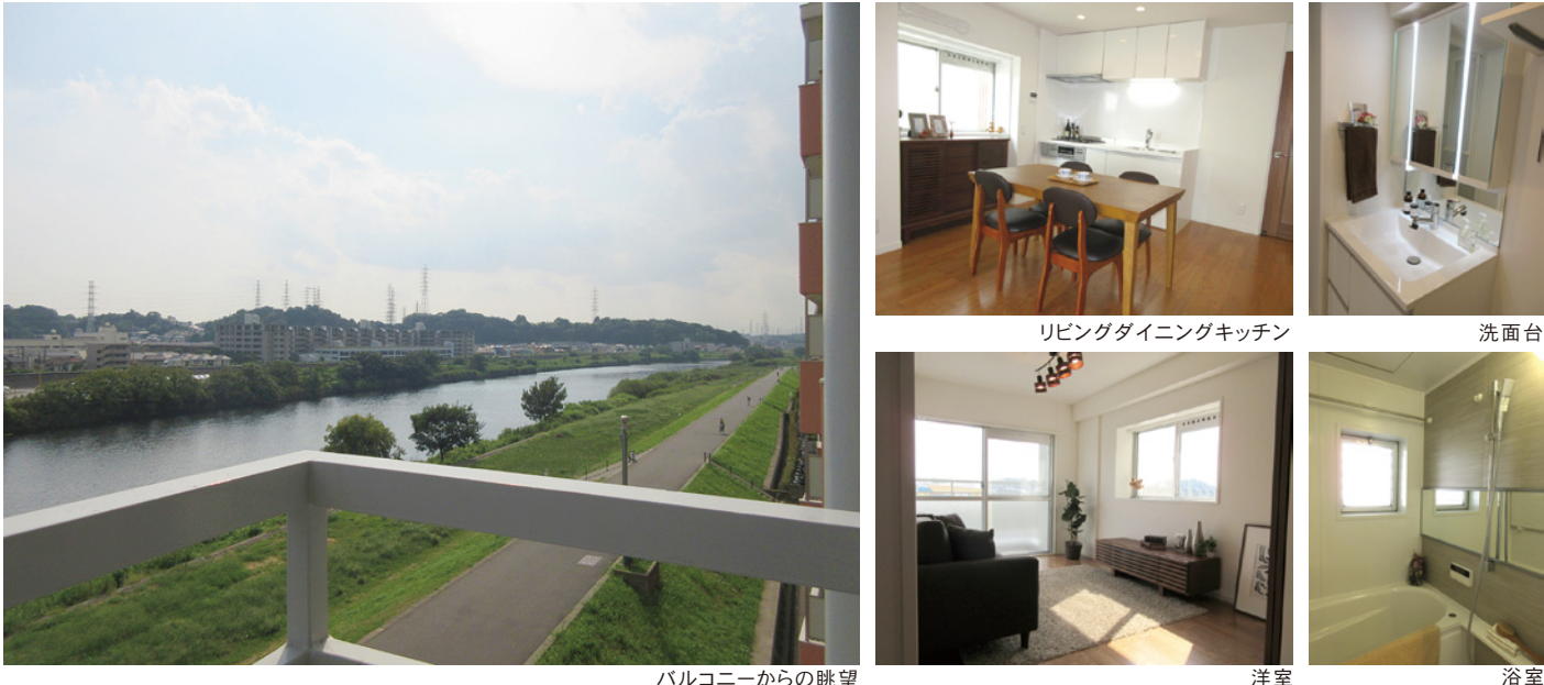
バルコニーからの眺望 リビングダイニングキッチン 洗面台 洋室 浴室