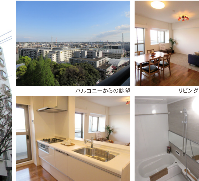
外観 バルコニーからの眺望 リビング キッチン 浴室